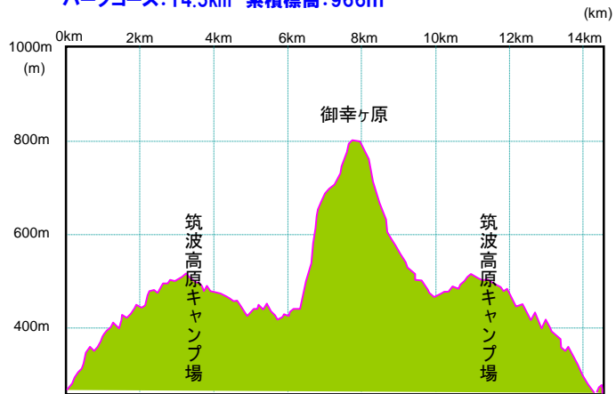
ハーフコース:14.5km 累積標高:966m